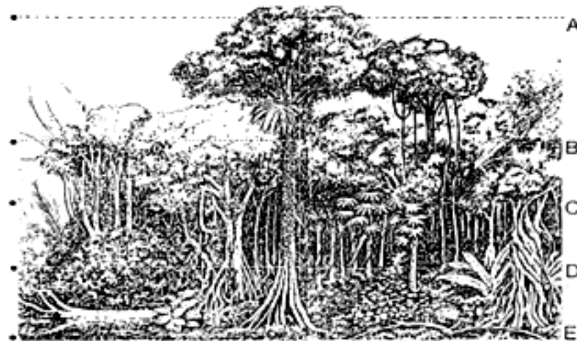
STRATIFIKASI HUTAN HUJAN TROPIS

bentuk pohon saja. Di samping itu, tidak semua hutan memiliki stratum seperti di atas, yang berarti hutan hanya mempunyai stratum A-B atau A-C saja. Tetapi yang penting menurut Richards (1952) ialah adanya peranan liana (tumbuh-tumbuhan pemanjat) berkayu yang dapat menjadi bagian dari tajuk hutan.